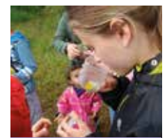
Gezellig met elkaar