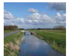
De Eerste Tocht